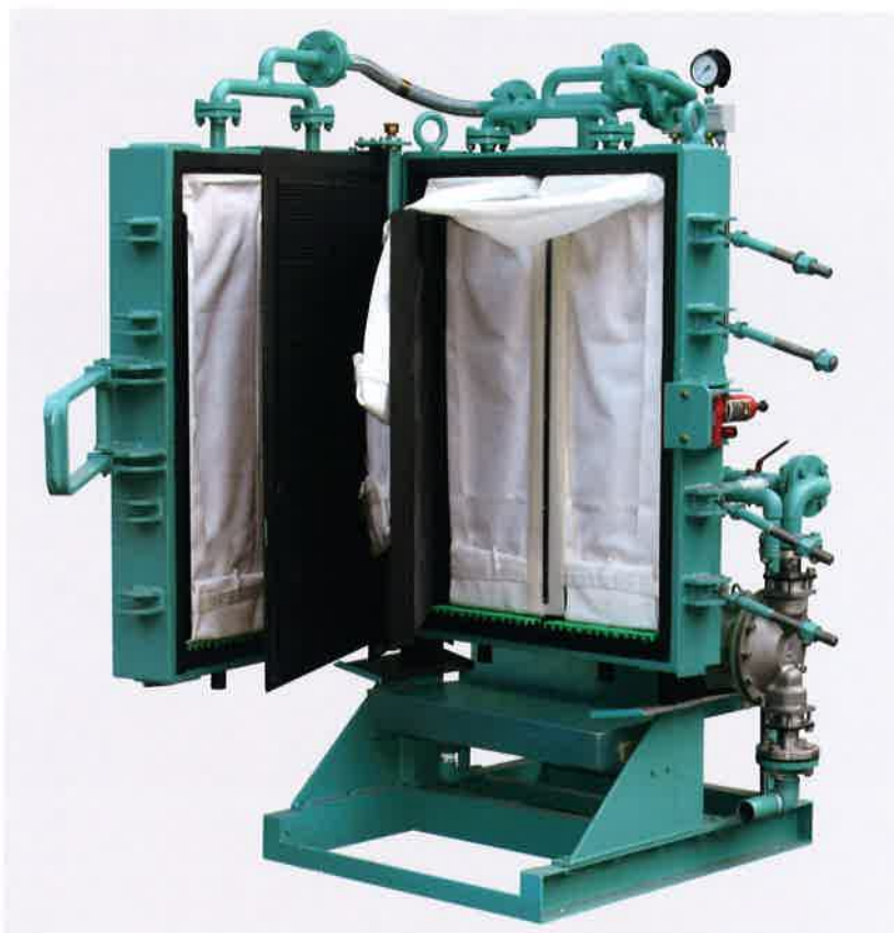
●脱水スラッジは、ろ布から直接容器へ。一面操作でろ板の開閉、脱水スラッジの取り出しが簡単。