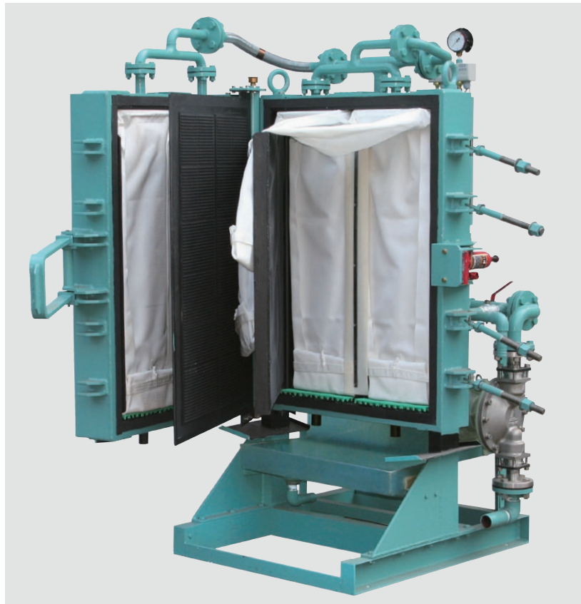
●脱水スラッジは、ろ布から直接容器へ。一面操作でろ板の開閉、脱水スラッジの取り出しが簡単。